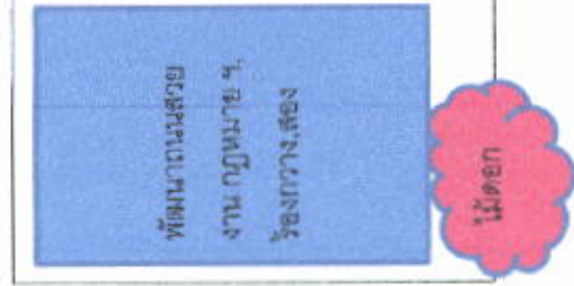
เต็นท์หลังที่ ๑