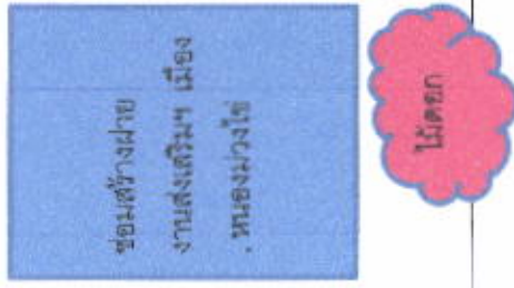
เต็นท์หลังที่ ๒