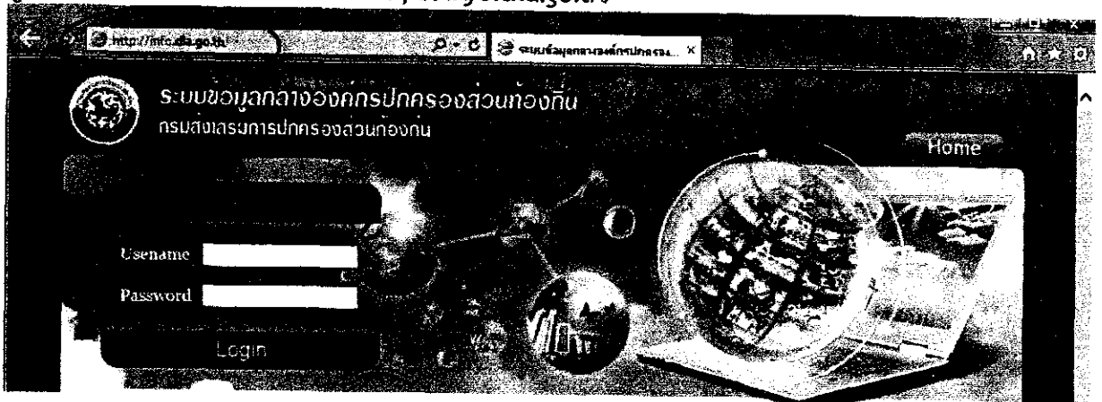
เว็บไซต์ ระบบข้อมูลกลางองค์กรปกครองท้องถิ่น

ผู้ใช้สามารถเข้าใช้ระบบได้ที่ URL : http://info.dla.go.th/