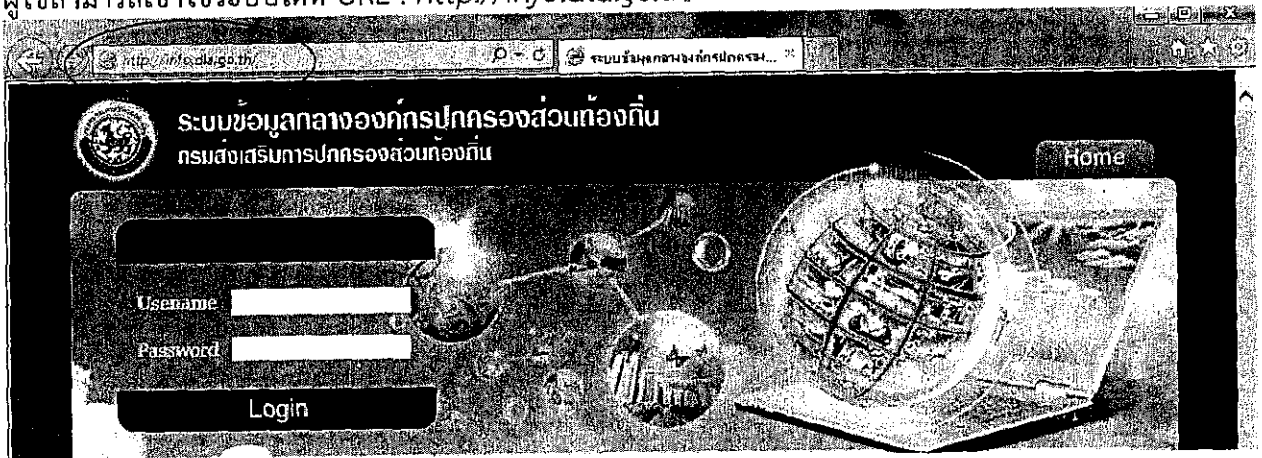
เว็บไซต์ ระบบข้อมูลกลางองค์กรปกครองส่วนท้องถิ่น

ผู้ใช้สามารถเข้าใช้ระบบได้ที่ URL : http://info.dla.go.th/