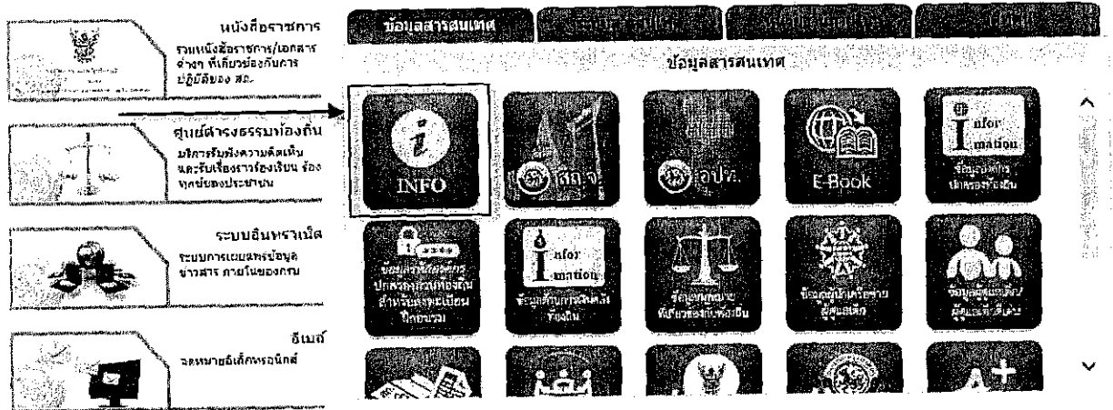
เว็บไซต์กรมส่งเสริมการปกครองท้องถิ่น

หรือเข้าผ่านทางหน้าเว็บไซต์กรมส่งเสริมการปกครองท้องถิ่น (www.dla.go.th) ในเมนู บริการ อปท. เลือก ระบบข้อมูลกลางองค์กรปกครองส่วนท้องถิ่น (INFO)