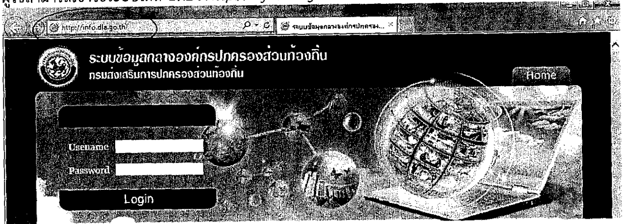
เว็บไซต์ ระบบข้อมูลกลางองค์กรปกครองท้องถิ่น

ผู้ใช้สามารถเข้าใช้ระบบได้ที่ URL : http://info.dla.go.th/