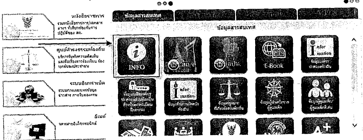
เว็บไซต์กรมส่งเสริมการปกครองท้องถิ่น

หรือเข้าผ่านทางหน้าเว็บไซต์กรมส่งเสริมการปกครองท้องถิ่น (www.dla.go.th) ในเมนู ข้อมูลสารสนเทศ เลือก ระบบข้อมูลกลางองค์กรปกครองส่วนท้องถิ่น (INFO)