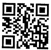
แบบรายงาน โรงเรียน ที่จัดการศึกษาระดับปฐมวัย

รับ ทวีศักดิ์ เลิศพิทักษ์ - ฝ่ายปกครอง (ว) - นส. ทวีศักดิ์ เลิศพิทักษ์ - ทน. นส. ทวีศักดิ์ เลิศพิทักษ์