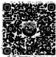
รายละเอียดโครงการ