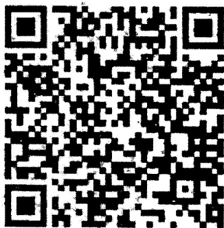
QR Code สมัครเข้าอบรม

หมายเหตุ : ผู้เข้ารับการอบรมที่ผ่านการประเมินและเข้าเรียนครบตามเวลา จะได้รับประกาศนียบัตรจากกรมอนามัย