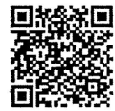
รายงานการฝึกอบรมฯ

กองสิ่งแวดล้อมท้องถิ่น กลุ่มงานสิ่งแวดล้อม โทร. ๐๒ ๒๔๑ ๙๐๐๐ ผู้ติดต่อการดำเนินงานส่งเสริมและพัฒนาท้องถิ่น โทรสาร ๐๒ ๒๔๑ ๒๐๖๖