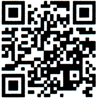
QR Code ตอรับการเข้าร่วมประชุม