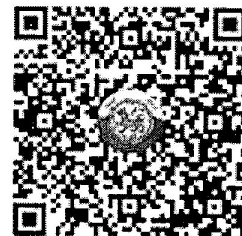
QR Code ๒ ตรวจสอบจำนวนผู้ชำระค่าลงทะเบียนแต่ละรุ่น