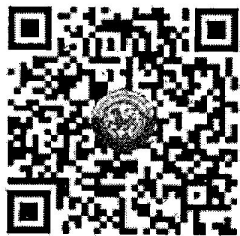
QR Code ๑ ยืนยันการเข้าร่วมประชุม