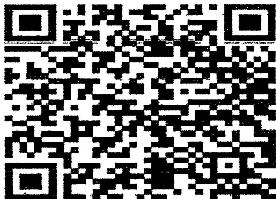
“แบบรายงาน”

- เลือกเดือนที่ต้องการรายงาน เมื่อเลือกเดือนเรียบร้อยแล้วให้เลือกอำเภอ เช่น รอบเดือนมกราคม ๒๕๖๗ เลือก “อำเภอเมืองแพร่” ใส่แบบรายงานข้อมูล (แบบ ๑ และ แบบ ๒) ของ “อบต.นาจักร” เป็นต้น