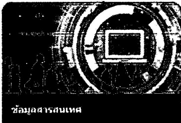
ข้อมูลสารสนเทศ