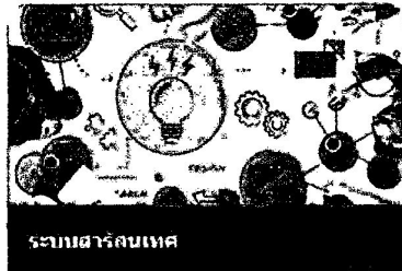
ระบบสารสนเทศ