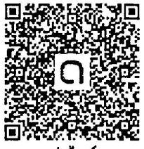
กลุ่มไลน์

พร้อม ทอ.มท.จังหวัดทุก - เพนกวิน odh. ๓๒๒ - ร้อยเอกอดิษฐ์ อดิษฐ์