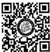
QR Code สมัคร

สามารถสมัครในรูปแบบ online โดยกรอกข้อมูลสมัครได้ที่Link https://lcis.crru.ac.th/training หรือ Scan QR Code เมื่อสมัครแล้วท่านสามารถพิมพ์ใบตอบรับยืนยันการสมัครเข้ารับการอบรมได้ทันที หรือ กรอกใบสมัครนี้ส่งมา โทรสารหมายเลข ๐๕๓๗๗๖-๑๓๑ หรือ e-mail : popa.training@gmail.com