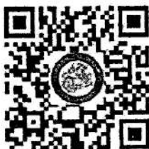
QR Code สำหรับการสมัครเข้าอบรม

๓. การแจ้งหลักฐานการโอนเงิน สามารถแจ้งได้ในระบบที่สมัครโดยสแกนจาก QR code ในเอกสาร หรือตาม Link นี้ https://lcis.crru.ac.th/training/welcome/howtopay