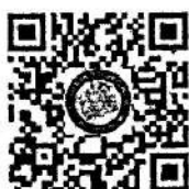
QR Code สำหรับการสมัครเข้าอบรม

๔. การแจ้งหลักฐานการโอนเงิน สามารถแจ้งได้ในระบบที่สมัครโดยสแกนจาก QR code ในเอกสาร หรือ ตาม Link นี้ https://lcis.crru.ac.th/training/welcome/howtopay