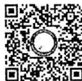
QR Code สำหรับแจ้งการชำระเงิน