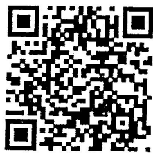
รายละเอียดหลักเกณฑ์ฯ (สิ่งที่ส่งมาด้วย)

รองประธานกรรมการ ปฏิบัติหน้าที่แทน ประธานกรรมการสภกรณ์ออมทรัพย์กรมการปกครอง จำกัด