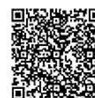
แบบฟอร์มจองห้องพัก