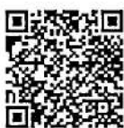
รายชื่อ รุ่นที่ ๖