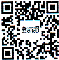
แบบฟอร์มที่เกี่ยวข้อง