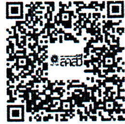
คู่มือการใช้ระบบบัตรประจำตัวพนักงานเจ้าหน้าที่ฯ