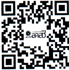
ระเบียบและประกาศที่เกี่ยวข้อง