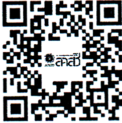
ระบบบัตรประจำตัวพนักงานเจ้าหน้าที่ฯ