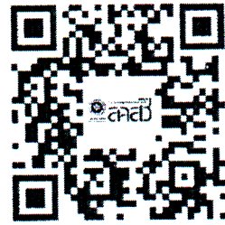
หลักสูตรความรู้พระราชบัญญัติสุภาพจิตฯ