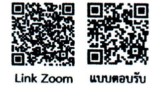
Link Zoom แบบตอบรับ