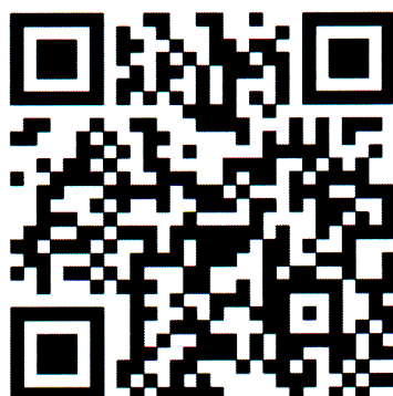
สิ่งที่ส่งมาด้วย ๒