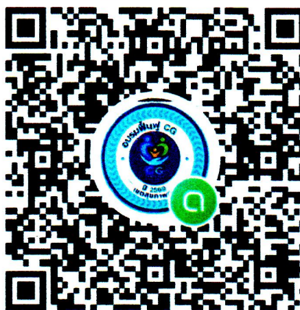
QR Code กลุ่ม Line Open Chat สำหรับผู้เข้ารับการอบรม CG ฟื้นฟู ปี ๒๕๖๙