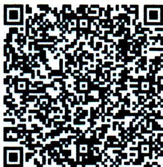
QR CODE เข้า Link การอบรม