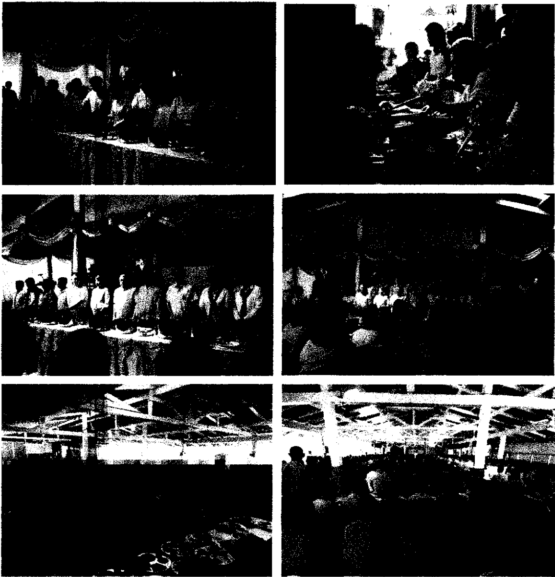
ผู้ว่าราชการจังหวัดแพร่ หัวหน้าส่วนราชการ ผู้แทนองค์กรปกครองส่วนท้องถิ่น และผู้มีเกียรติมอบอาหารกลางวัน และสิ่งของเครื่องใช้